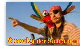
Spooky der Steuermann

Das Allround-Talent Spooky bietet eine Animationsshow rund um die Seefahrt mit Musik und Geschichten quer durch die wilden Meere. Auf der Bühne stehen drei charakterstarke, tollkühne Seemänner – in einer Person. Verkleidet als Kapitän, als Pirat und als Matrose bringt der Künstler eine maritime-musikalische Liveshow auf die Bühne, erzählt verrückte Geschichten von der See und haut die Sprüche nur so raus.